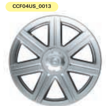
Llantas delanteras de 18" y traseras de 19".

LA REFINADA COORDINACIÓN DE COLORES DEMUESTRA EL BUEN GUSTO DEL CROSSFIRE. DE SERIE, LA TAPICERÍA DE CUERO NAPA OFRECE TRES ALTERNATIVAS: DOS COMBINACIONES BITONO Y GRIS OSCURO. (EL COLOR ROJO BRILLANTE METALIZADO NO ESTÁ DISPONIBLE CON LA COMBINACIÓN GRIS OSCURO/CEDRO).